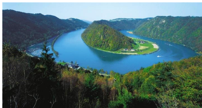
Die „Schlägener Schlinge“

Reisedienst Warias GmbH Erich-Ollenhauer-Str. 42 59192 Bergkamen Tel: 02307/88367 Fax: 02307/83404 e-mail: info@reisedienst-warias.de